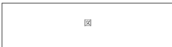
図1 図題はセンタリング

図題は、図の下に付ける。図題には、通し番号を付ける。「図1」のように、図題はゴシック、図番はArialである。たとえ原稿中に図が一つしかなくても、「図1」となる。